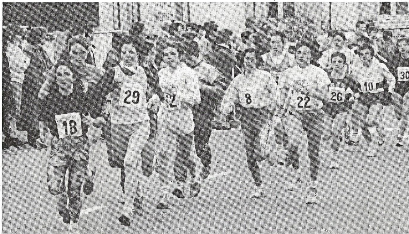
Hier après-midi, les rues d'Ingersheim ont été livrées aux femmes. Des athlètes courageuses qui ont été fortement applaudies sur le parcours.

De nombreuses personnalités ont suivie la manifestation notamment M. Jean-